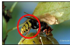
Extrémité des pattes de couleur brune