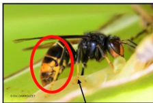
Extrémité des pattes de couleur jaune

Abdomen noir avec une large bande orangée