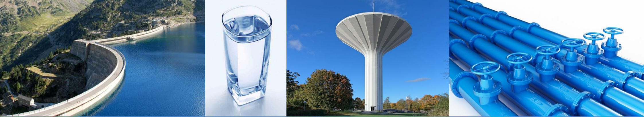
Schéma Directeur d'Alimentation en Eau Potable (SDAEP)